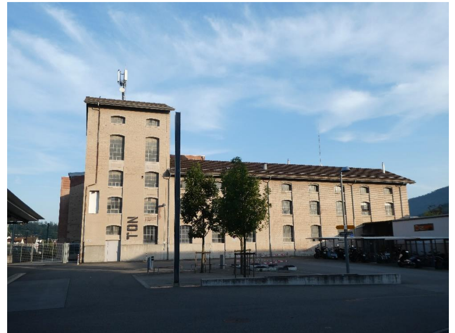
Bahnhofplatz Nord mit altem Tonwerk-Gebäude